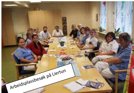
Arbeidsplassbesøk på Liertun

Gjennom høste har vi hatt flere arbeidsplassbesøk. Her er noen bilder alt fra bruk stemmeretten din til vanlige arbeidsplassbesøk.