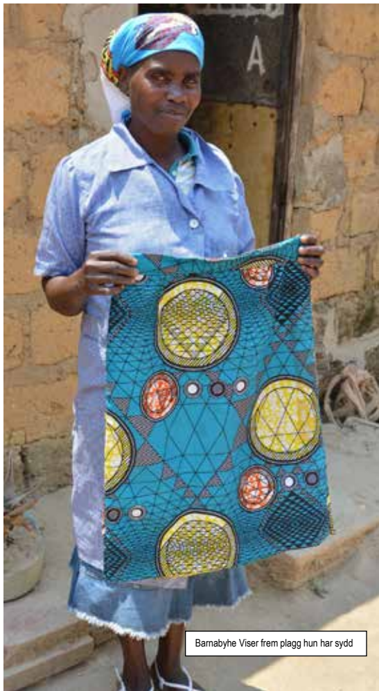
Barnabyhe Viser frem plagg hun har sydd

Ønsker du å bli fast bidragsgiver til Fagforbundet sitt flott https://www.sos-barnebyer.no/fagforbundet