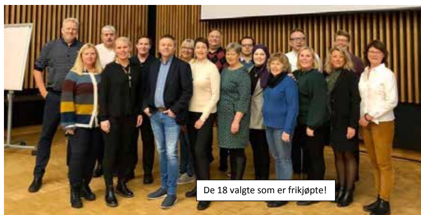
De 18 valgte som er frikjøpte!