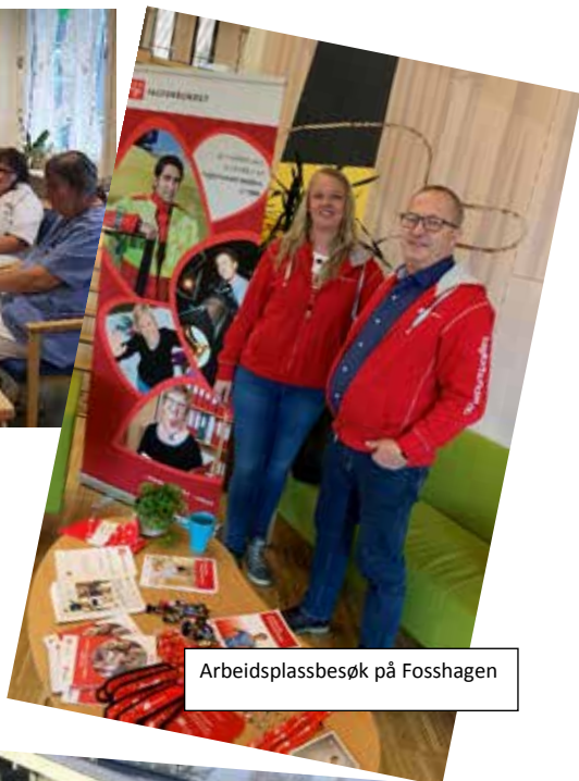
Arbeidsplassbesøk på Fosshagen