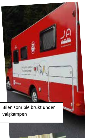
Bilen som ble brukt under valgkampen

Fra «bruk stemmeretten din» hvor Tove Bøygard var med og hadde minikonsert, her fra Fosskvartalet i Lierbyen.