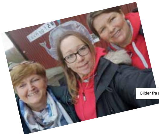
Bilder fra arbeidsplassbesøk