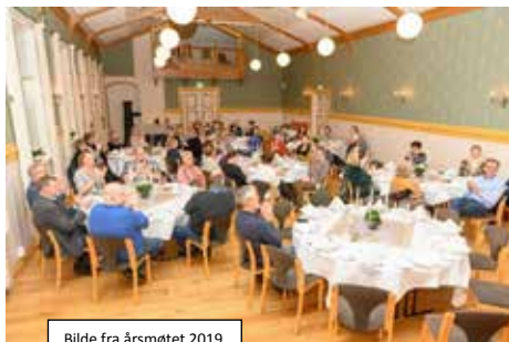
Bilde fra årsmøtet 2019

Resultatet fra Tariffkonferansen som ble avholdt på Kongsberg i etterkant av alle innkomne forslag fra fagforeningene i Buskerud, ble som du kan lese under. Alle innspill ble vedlagt, og her er i korte trekk det vi ble enige om, skulle komme fra Buskerud.